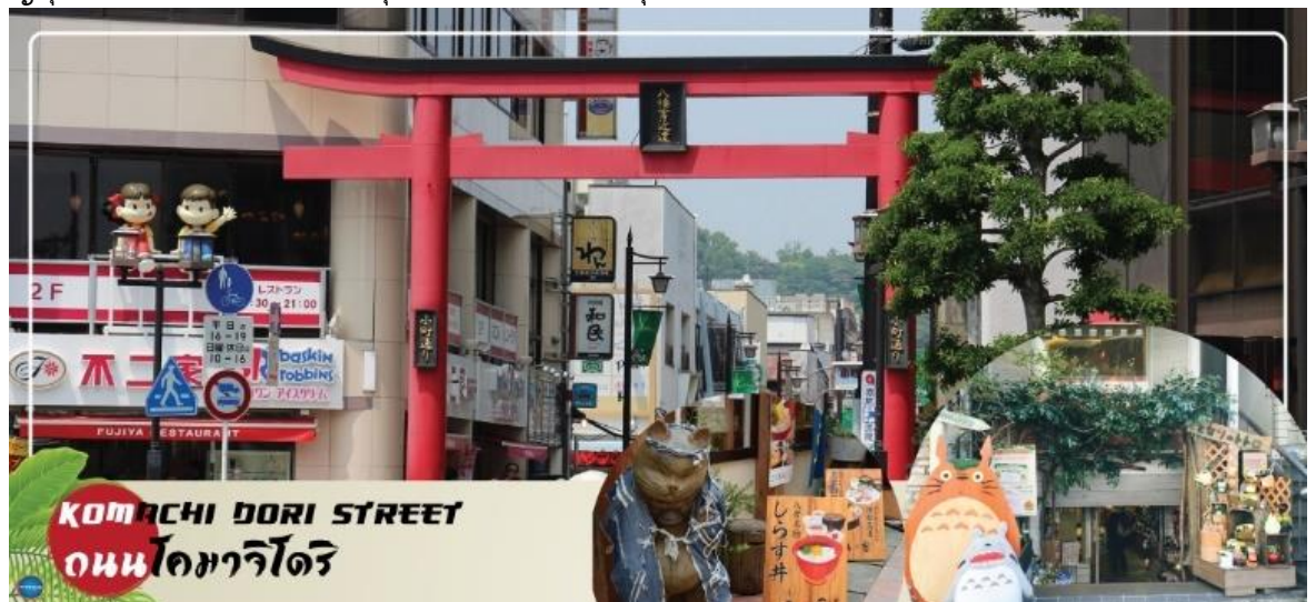
KOMACHI DORI STREET ถนนโคมาจิโดริ

บริเวณใกล้เคียงกัน ถนนโคมาจิโดริ (Komachi Dori Street) ตลอดระยะทางราวๆ 350 เมตรของถนนโคมาจิโดรินี้ เต็มไปด้วยร้านค้าละลานตากว่า 250 ร้าน ไม่ว่าจะเป็นร้านอาหารท้องถิ่น ร้านขายของที่ระลึก ร้านเช่ากิโมโน คาเฟ่แสนน่ารัก ร้านหนังสือ สินค้าทำมือ ขนมญี่ปุ่นโบราณที่หา কিনได้ยากจากที่อื่น ร้านค้าส่วนมากยังอนุรักษ์รูปแบบอาคารดั้งเดิม ให้ความรู้สึกราวกับเดินในเมืองเก่าของญี่ปุ่น ร้านค้าบางร้านก็ปรับปรุงเปลี่ยนแปลงตามยุคสมัย