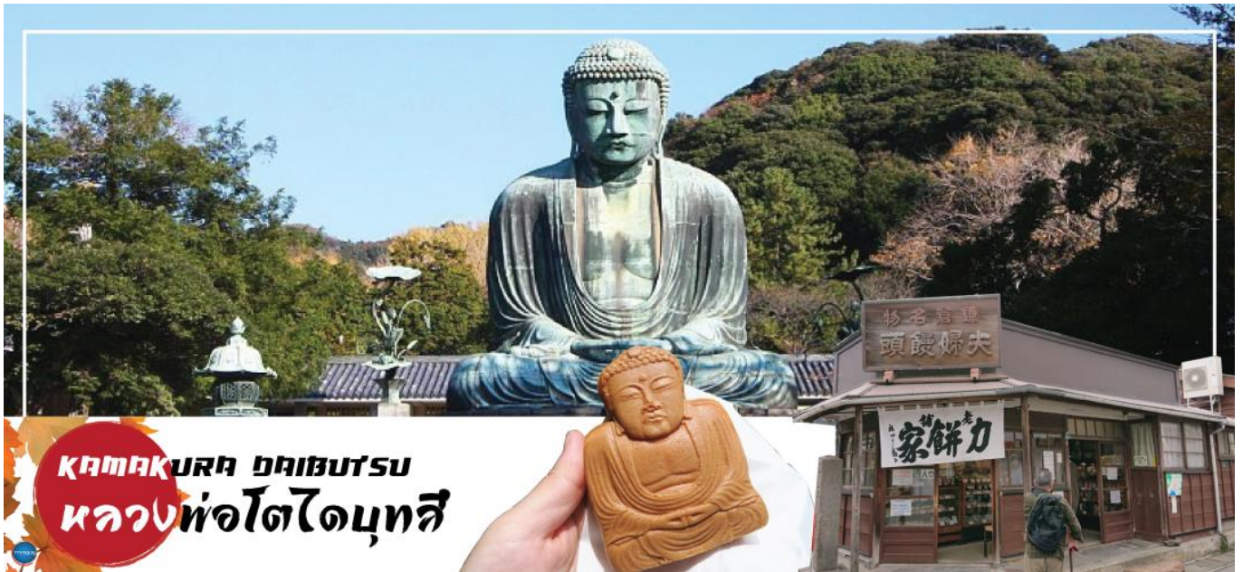
KAMAKURA ภูมิภาคชิบุดะ หลวงพ่อโตโตบุทชิ