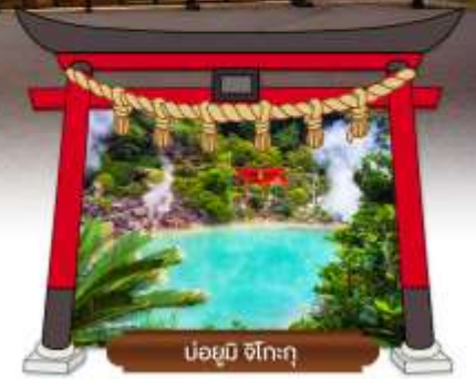
บ่อยูมิ จิโกะกุ