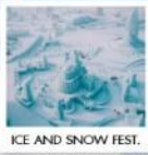
ICE AND SNOW FEST.