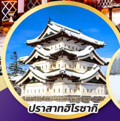
ปราสาทฮิโรซากิ