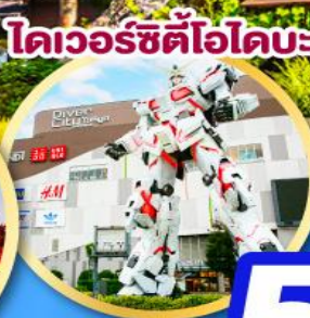
โดเวอร์ซิตี้ออโดบะ