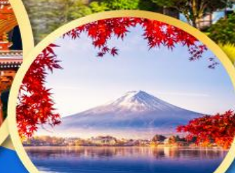
ภูเขาไฟฟูจิ