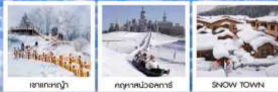
เซาเกาะหญา