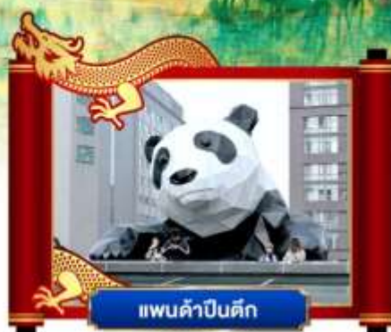
แพนด้าเซลฟี