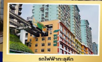
รถไฟฟ้าหลู่คิง