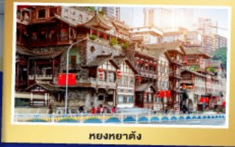
หยงหยาดัง