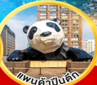
แพนด้าป็นตึก