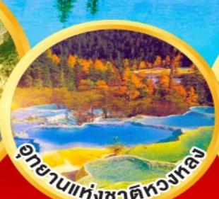
อุทยานแห่งชาติหลงหลง