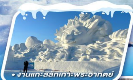
• งานแกะสลักเกาะพระอาทิตย์

ชมดอกเกล็ดหิมะ อุ้ง ทัศนียภาพอัศจรรย์แห่ง ทะเลสาบกระจก จิ้งป้อหู