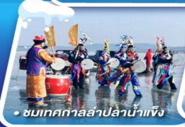
• ชมเทศกาลล่่าปลาน้ำแข็ง