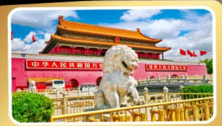
จตุรัสเทียนอันเหมิน