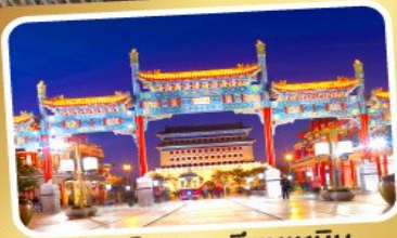
ถนนโบราณเทียนเหมิน