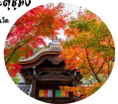
จุดประตูซุง เป็นประตูด้านใน บริเวณด้านในวัด