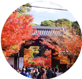
จุดประตูโซมง เป็นประตูทางเข้าหลักของวัดเอคันโด

นำท่านเยี่ยมชม วัดเอคันโด หรือที่รู้จักกันอีก 3 ชื่อ อาทิ เซนรินจิ ไชจูโรงะซัง และมุเรียวจูอิน วัดแห่งนี้ตั้งอยู่ทางฝั่งใต้ของ ทางเดินนักปราชญ์ (Philosopher's Path) ตรงใจกลางเมืองอิงาชิยามะ พื้นที่ตรงนี้กว้างใหญ่โดยมีอาคารมากมายที่เชื่อมถึงกันด้วยทางเดินแบบมีหลังคาคลุม วัดแห่งนี้คือของขวัญที่ขุนนางตุลาการในสมัยเออัน (ปี 794-1185) มอบให้พระสงฆ์ ภายในวัดเต็มไปด้วยงานศิลปะหลากหลายชิ้น โดยชิ้นที่มีชื่อเสียงที่สุดคือรูปปั้นพระอมิตาพุทธ ซึ่งพระเศียรหันไปด้านหนึ่งแทนที่จะมองตรงมาทางด้านหน้าอย่างที่เห็นกันตามปกติ ตำนานเล่าไว้ว่าขณะที่เจ้าอาวาสประกอบพิธีสำหรับพระพุทธรูปองค์นี้ ท่านได้หันมามองและพูดคุยกับเจ้าอาวาส อีกทั้งยังเป็นวัดที่รู้จักกันดีว่ามีใบไม้ที่สวยงามมีชื่อเสียงในการชมใบไม้เปลี่ยนสีในช่วงฤดูใบร่วงตอนประมาณปลายเดือนพฤศจิกายนถึงต้นเดือนธันวาคม โดยจะงดงามมากขึ้นไปอีกจากแสงที่มาจากกระทะบิยามเย็น ภายในวัดมีมุมถ่ายรูปกับใบไม้เปลี่ยนสีมากมาย อาทิ