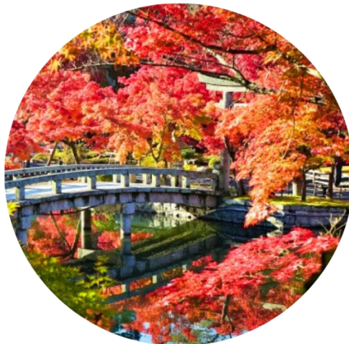
จุดร้านน้ำชา และนกพิราบ ที่ให้ภาพบรรยากาศที่งดงามของลานหนึ่งสีแดง ที่ปกคลุมไปด้วยใบไม้เปลี่ยนสี

บ่อน้ำที่อยู่ใจกลางวัด มีสะพานข้ามมายังศาลเจ้าถือเป็นจุดถ่ายภาพยอดนิยม