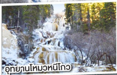
อุทยานโหมวหนี่โกว