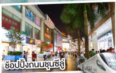
ช้อปปิ้งถนนชุนซีลู่