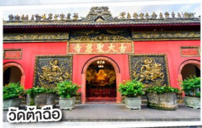
วัดต้าฉีอ้อ