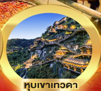
หุบเขาเกวดา