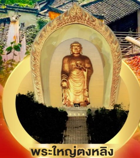
พระใหญ่ตงหลิง