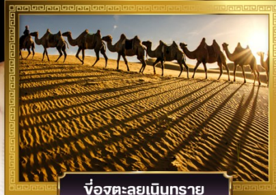
ขบวนคาราวานทะเลทราย