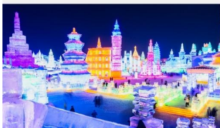
เทศกาลโคมไฟน้ำแข็ง