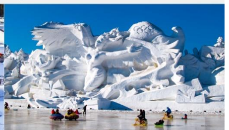
เกาะพระอาทิตย์

*ทางบริษัทฯ ขอสงวนสิทธิ์ในการสลับโปรแกรมทัวร์ตามความเหมาะสมขึ้นอยู่กับสถานการณ์หน้างาน โดยคำนึงถึงผลประโยชน์ของลูกค้าเป็นสำคัญ