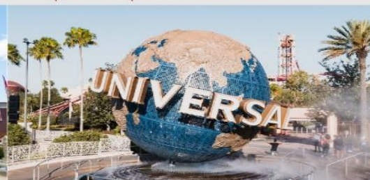
ยูนิเวอร์เซล ปักกิ่ง รีสอร์ท