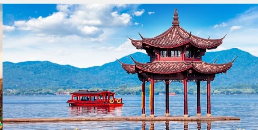
ล่องเรือชมทะเลสาบซีหู