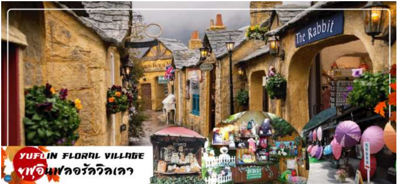
เที่ยง เลือกรับประทานอาหารกลางวัน ณ หมู่บ้านยูฟุอินตามอัตราค่า (3) Cash Back ท่านละ 1000 เยน (จ่ายโดยไกด์หน้างาน)