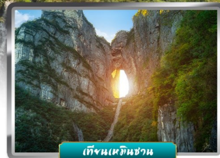
เทียนเหมินชาน