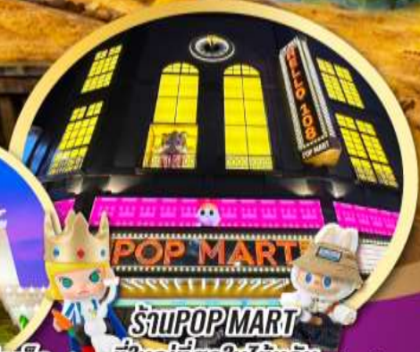
ร้าน POP MART ที่ใหญ่ที่สุดในไต้หวัน เริ่มต้น

เมนูพิเศษ!! ซามู บุฟเฟ่ต์ ปลาประสาธนาธิบดี, เสี่ยวหลงเปา