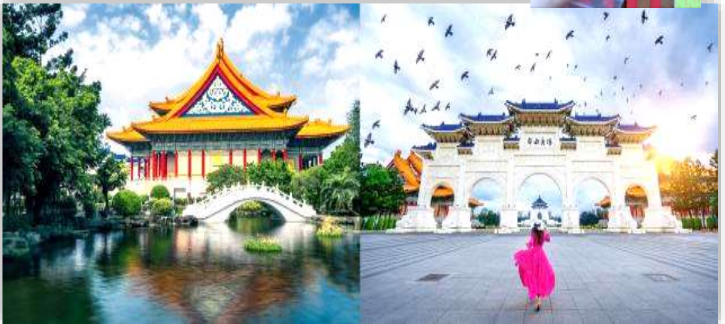
นาทานเดินทางสู่แลนด์มาร์คสำคัญของไทเปที่มณฑลทงเทยวมาเยี่ยมชมอย่างเมฆาดสาย อนุสรณ์สถานเจียงไคเช็ค Chiang Kai-Shek Memorial Hall

Shek Memorial Hall โดยตัวอาคารของอนุสรณ์สถานถูกสร้างขึ้นตามแบบสถาปัตยกรรมจีนโบราณ บันไดทั้งสี่ด้านถูกสร้างด้วยหินอ่อนสีขาวเป็นชั้นตามแบบพีระมิดอียิปต์ หลังคาสีน้ำเงิน รวมทั้งยังมีสวนดอกไม้สีแดง ที่เป็นการแสดงออกทางสัญลักษณ์ให้เห็นถึงอิสรภาพ ความเท่าเทียม และความเป็นหนึ่งเดียวกัน ตามสีของธงชาติไต้หวัน อนุสรณ์สถานแห่งนี้ถูกสร้างขึ้นเพื่อเป็นที่รำลึกถึงอดีตประธานาธิบดีเจียงไคเช็ค ซึ่งเป็นบุคคลที่มีความสำคัญต่อไต้หวัน ภายในห้องมีการจัดแสดงประวัติและสิ่งของต่างๆเกี่ยวกับท่านนายพลเจียงไคเช็ค ตั้งแต่สมัยที่ยังเป็นลูกศิษย์ ดร. ซุนหยัตเซ็น จนก้าวสู่ตำแหน่งผู้นำประเทศ เป็นแหล่งรวมชีวประวัติและรูปภาพประวัติศาสตร์ที่สำคัญที่หาดูได้ยาก