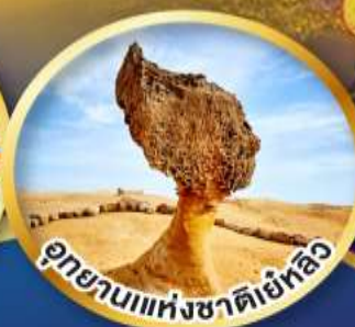
อุทยานแห่งชาติเย้หลิว