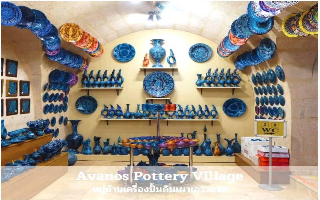
Avanos Pottery Village หมู่บ้านเครื่องปั้นดินเผาเอวานอส

เย็น ที่พัก รับประทานอาหารเย็น ณ ห้องอาหารของโรงแรม 📍 CAPPADOCIA HOTEL หรือเทียบเท่า