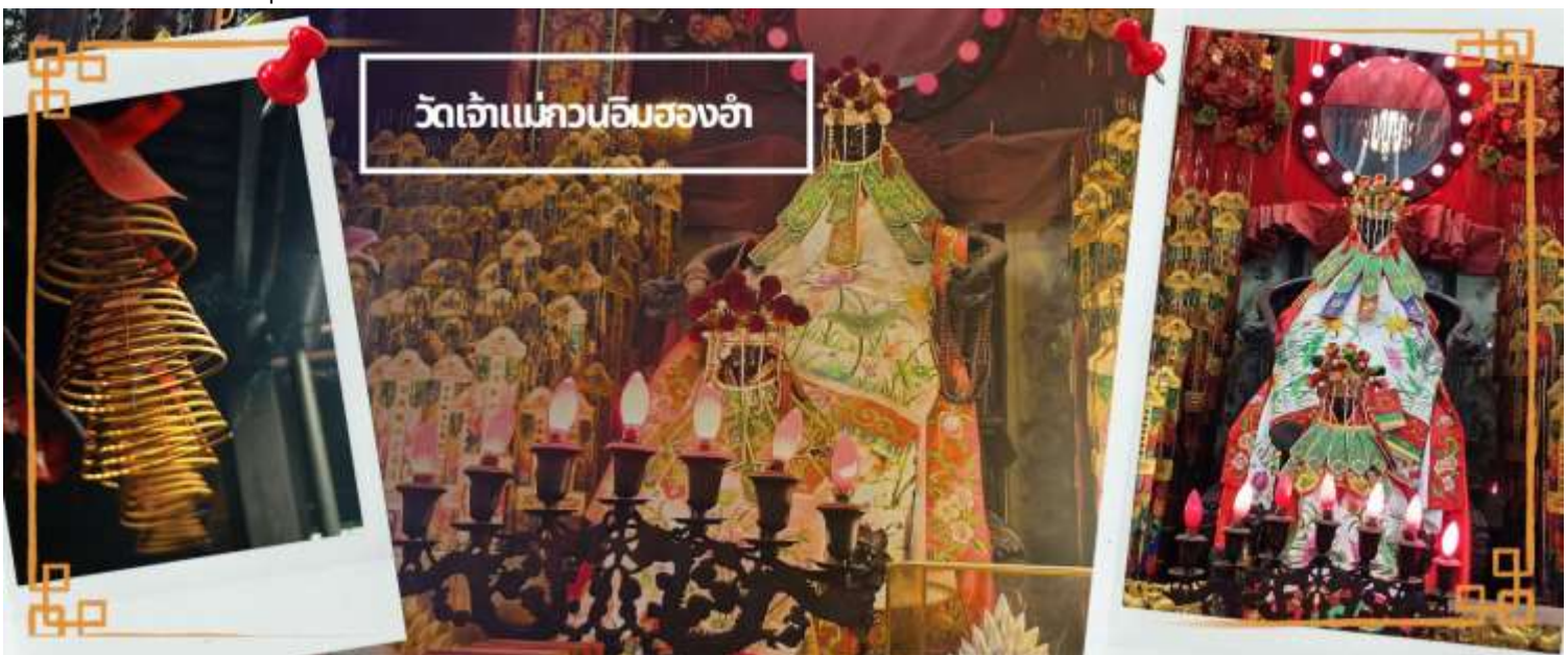
วัดเจ้าแม่กวนอิมสองห้า

จากนั้นนำท่านเดินทางสู่ วัดเจ้าแม่กวนอิมสองห้า (HUNG HOM KWUN YUM TEMPLE) เป็นหนึ่งในวัดที่ชาวฮ่องกงนั้นเลื่อมใสกันมาก ด้วยความที่เจ้าแม่กวนอิมนั้นเป็นเทพเจ้าแห่งความเมตตา ฉะนั้นเมื่อใครมีทุกข์ร้อนอะไรก็มักจะมากราบไหว้ขอพรให้เจ้าแม่ช่วยเหลือ วัดนี้ถูกสร้างขึ้นในปี ค.ศ. 1873 ในช่วงสงครามโลกครั้งที่ 2 มีการปล่อยระเบิดลงบริเวณวัดสองห้าหลายต่อหลายครั้ง ทำให้มีผู้บาดเจ็บและล้มตายมากมาย แต่ชาวบ้านที่หนีเข้าไปหลบภัยในวัดนี้ก็ปลอดภัยและตัววัดก็ไม่ได้ได้รับความเสียหายจากเหตุการณ์ทิ้งระเบิดอย่างน่าอัศจรรย์ และวันสำคัญอีกวันหนึ่งที่คนฮ่องกงมาไหว้ขอพรอย่างไม่ขาดสาย และรอคอยเป็นประจำทุกปี ก็คือ "วันเปิดทรัพย์" หรือ วันยืมเงินเทพเจ้า เป็นวันที่จะมาขอพรและยืมเงินเจ้าแม่กวนอิม ซึ่งตรงกับวันที่ 26 นับจากวันตรุษจีน ซึ่งพิธีนี้ใน 1 ปี มีเพียงครั้งเดียวเท่านั้น