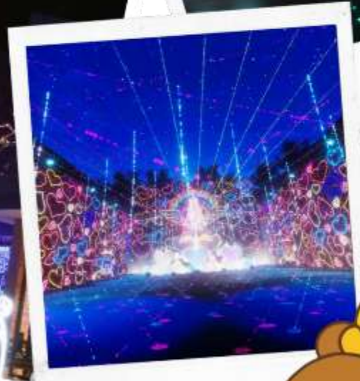
งานประดับไฟ