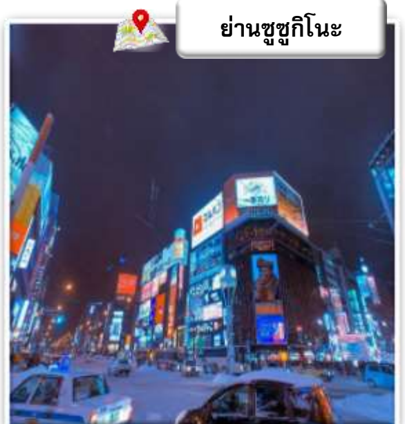
ย่านซุซึกินะ

ย่านซุซึกินะ เป็นย่านบันเทิงและย่านซัปโปโรที่ใหญ่ที่สุดในทางตอนเหนือของญี่ปุ่น เต็มไปด้วยร้านค้า บาร์ ร้านอาหาร ร้านคาราโอเกะ และตู้ปิงปอง รวมกว่า 4,000 ร้าน ป้ายร้านค้าสว่างไสวยามค่ำคืนจนถึงเที่ยงคืนเลยทีเดียว ในช่วงเดือนกุมภาพันธ์ ย่านซุซึกินะจะจัดเทศกาลหิมะ เป็นเจ้าภาพการแข่งขันแกะสลักน้ำแข็ง ประจำปี จากนั้นเดินทางสู่ SAPPORO (ซัปโปโร) หนึ่งในเมืองหลักของเกาะ Hokkaido (ฮอกไกโด) เป็นเมืองหลักที่เป็นศูนย์กลางการท่องเที่ยวของเกาะ มีสถานที่ท่องเที่ยวหลากหลาย และเป็นศูนย์กลางในการเดินทางไปในหลายๆ สถานที่ของเกาะฮอกไกโด