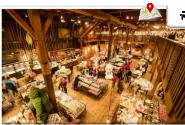
พิพิธภัณฑ์กล่องดนตรีโอตารุและหอนาฬิกาไอน้ำ

คลองโอตารุ (Otaru Canal) หรือในภาษาญี่ปุ่นเรียกว่า โอตารุอุงะ (Otaru Unga) เป็นคลองที่มีความสวยงามซึ่งไหลผ่านกลางเมืองโอตารุ เป็นแหล่งดึงดูดนักท่องเที่ยวที่สำคัญของเมืองในทุกฤดูกาล สามารถเดินเล่นริมคลองและมีบริการล่องเรือในคลองอีกด้วย ส่วนบริเวณริมคลองตกแต่งด้วยคอมไฟสไตลวิคตอเรียนและมีอาคารโกดังที่สร้างจากอิฐเป็นแนวยาวไปตามคลอง ซึ่งในสมัยก่อนใช้เป็นโกดังสินค้าและในปัจจุบันได้กลายมาเป็นร้านอาหาร ทำให้ได้บรรยากาศโรแมนติกมาก ๆ ในช่วงเดือนกุมภาพันธ์ของทุกปียังใช้เป็นหนึ่งในสถานที่จัดงานเทศกาลหิมะช่วงหน้าหนาวซึ่งจะมีการประดับตกแต่งด้วยคอมไฟท์ในเมือง