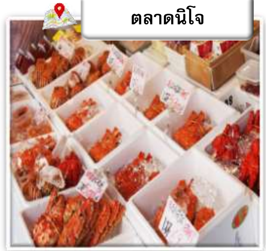
ตลาดนิโจ

ตลาดนิโจ มีประวัติศาสตร์ยาวนานกว่า 100 ปี เปรียบเสมือนห้องครัวของชาวเมืองซัปโปโรมาตั้งแต่สมัยก่อน นอกจากปลาแซลมอน ปู และหอยเชลล์ที่เป็นอาหารทะเลเด่น ๆ ของฮอกไกโดแล้ว ยังเต็มไปด้วยผลผลิตทางการเกษตรอย่างผลไม้และผักนานาชนิด นับเป็นตลาดที่ขาดไม่ได้สำหรับชาวเมืองซัปโปโรเลยทีเดียว ที่ตลาดนิโจในปัจจุบัน นอกจากจะมีร้านที่เปิดกิจการต่อเนื่องมาหลายสิบปี ก็ยังมีร้านที่เพิ่งเปิดใหม่ และบริเวณรอบ ๆ ก็มีร้านอิซากายะ (ร้านเหล้า) และร้านอาหารที่มีเอกลักษณ์เฉพาะตัวเพิ่มมากขึ้น ที่นี่จึงกลายเป็นสถานที่ท่องเที่ยวยอดนิยมที่สามารถมาทานอาหารทะเลสด ๆ ก็ได้ มาเลือกซื้อของฝากก็ได้