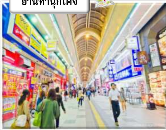
ย่านทานุกิโคจิ

ย่านทานุกิโคจิ (Tanuki Koji) ถือว่าเป็นย่านซัปโปโรชื่อดังของเมืองซัปโปโร เป็นแหล่งซัปโปโรในร่มที่มีหลังคาคลุมยาวตามแนวถนน ยาว 1 กิโลเมตร หรือประมาณ 7-8 บล็อก จนถึงแม่น้ำ Sosei ที่นี่เปิดมานานเป็นร้อยปี นับว่าเป็นตลาดเก่าแก่ที่เปิดตั้งแต่ปี ค.ศ. 1873 โดยสองข้างทางเต็มไปด้วยร้านค้ากว่า 200 ร้าน ทั้ง ร้านขายของที่ระลึก ขนม ของเล่น เครื่องสำอาง ซ็อคโกแลต เสื้อผ้า ข้าวของเครื่องใช้ต่าง ๆ และร้านอาหารให้เลือกรับประทานมากมาย