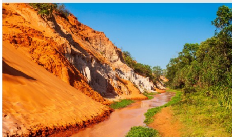
ลำธารนางฟ้า