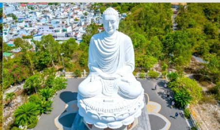
วัดลองเซิน