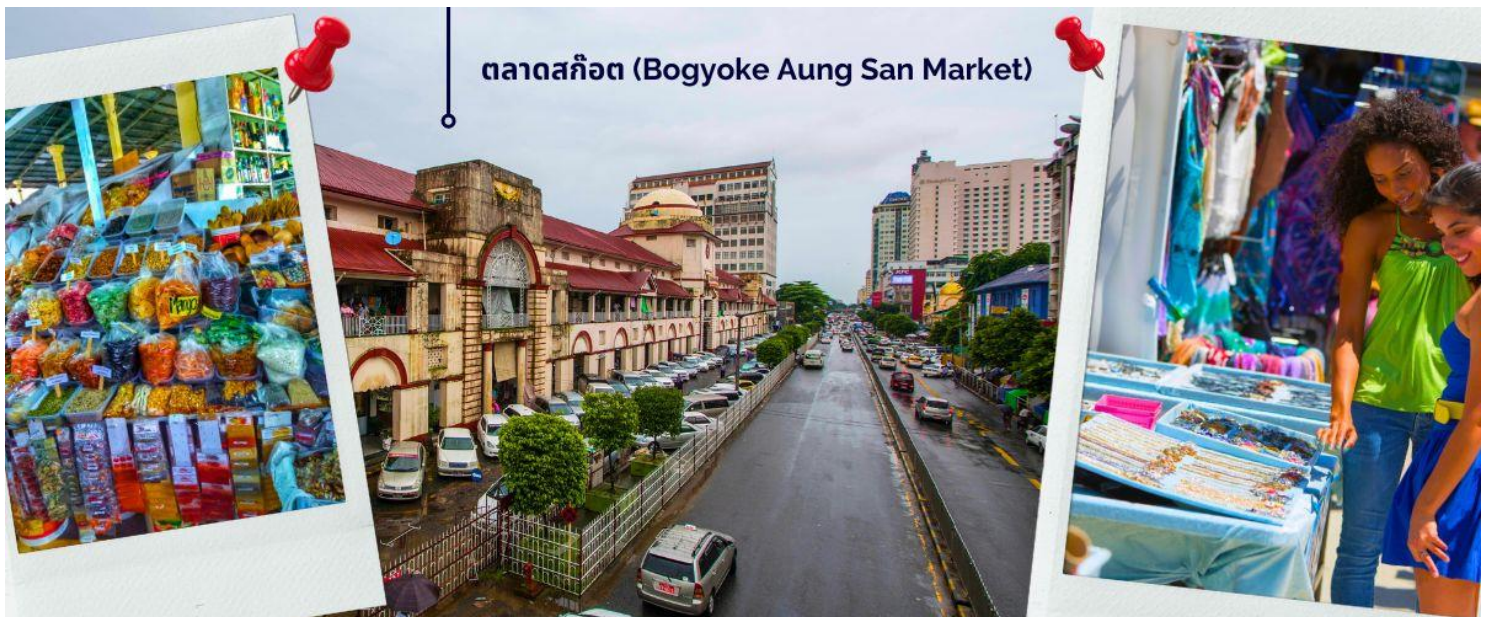
ตลาดสก๊อต (Bogyoke Aung San Market)

ให้ท่านได้มีเวลากับการเลือกซื้อของฝาก ของที่ระลึกต่างๆ ทั้งสินค้าพื้นเมืองที่มีชื่อเสียงของพม่าที่ ตลาดสก๊อต (Bogyoke Aung San Market) นี่คือนตลาดที่ใหญ่ที่สุดในย่างกุ้ง เป็นแหล่งช้อปปิ้งที่มีสินค้าวางขายแทบทุกชนิด เปรียบเสมือนตลาดนัดจตุจักรของบ้านเราก็คงได้ นอกจากสินค้าพื้นเมืองแล้ว ตลาดแห่งนี้ยังเป็นแหล่งรวมสินค้าประเภทอัญมณีที่เป็นที่รู้จักไปทั่วโลกนั่นคือ หยกพม่า (หากซื้อสินค้าหรืออัญมณีที่มีราคาสูง ควรขอใบเสร็จรับเงินทุกครั้ง เนื่องจากจะต้องแสดงให้เห็นเจ้าหน้าทีศุลกากรหากมีการขอตรวจสอบ)