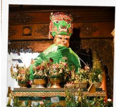
ขอพรแม่ย่า