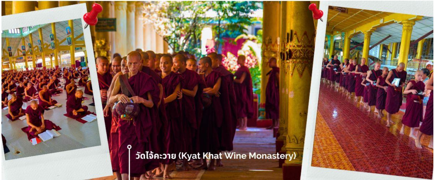
วัดใจ้คะวาย (Kyat Khat Wine Monastery)

นำท่านเดินทางลงจากพระธาตุนันทน์แขวน โดยใช้เส้นทางเดิม เพื่อมุ่งหน้าสู่เมืองหงสาวดี (ใช้เวลาเดินทางประมาณ 1 ชั่วโมง 30 นาที) เชิญร่วมทำบุญตักบาตรพระสงฆ์ ณ วัดใจ้คะวาย เมืองหงสาวดี มีพระสงฆ์กว่า 1000 รูป เป็นโรงเรียนสอนพระพุทธศาสนา นักรธรรมชั้นตรี โท และ เอก เพื่อศึกษาพระไตรปิฎกเป็นจำนวนมาก ในช่วงสายของทุกวัน พระสงฆ์และเณร จะเดินออกมาบิณฑบาตเพื่อเตรียมฉันเพล โดยวัดแห่งนี้ ได้รับการสนับสนุนจากชาวพุทธในพม่าเองและนักท่องเที่ยวที่เดินทางมาที่วัด เพื่อทำการถวายเงินปัจจัย หรือข้าวสาร รวมไปถึง อุปกรณ์การเรียนและเครื่องเขียนต่างๆ เพื่อใช้ในการ ศึกษาธรรมะของพระสงฆ์และเณรในวัดใจ้คะวายแห่งนี้