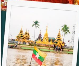
เจดีย์กลางน้ำเยเลพญา