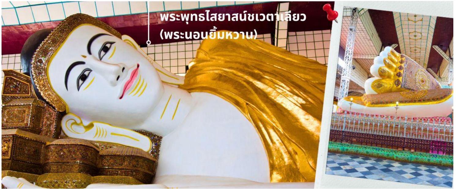
พระพุทธรไสยาสน์ชเวตาเลียว (พระนอนยิ้มหวาน)

ได้เวลาอันสมควร นำท่านเดินทางกลับสู่เมืองย่างกุ้ง