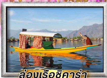
ล่องเรือชิคาร่า