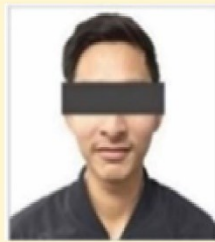
รูปถ่าย ขนาด 2*2 นิ้ว