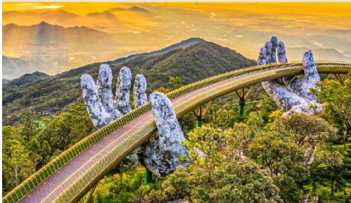
บานาฮิลล์