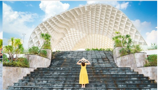
สวนเอเปค

*กรณีห้องพัkbานาฮิลล์เต็ม ขอสงวนสิทธิ์ในการเปลี่ยนวันเข้าพัก และปรับเปลี่ยนโปรแกรมโดยคำนึงถึงผลประโยชน์ลูกค้าเป็นสำคัญ