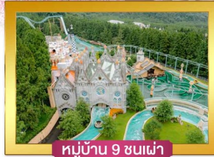
หมู่บ้าน 9 ชนเผ่า