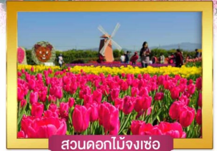
สวนดอกไม้เมืองเซ่อ