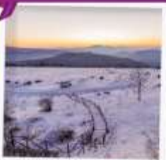
เขาแคะกัญญา