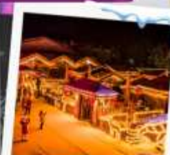
ถนนเส่ซุ่นเจีย