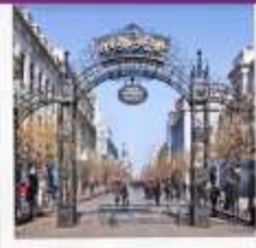
ถนนจงหยาง