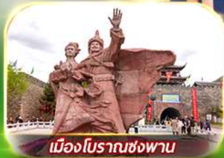
เมืองโบราณซ่งพาน