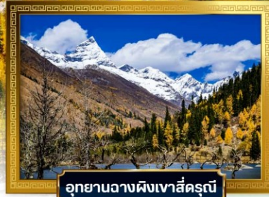
อุทยานฉางผิงเวาสีครุณี