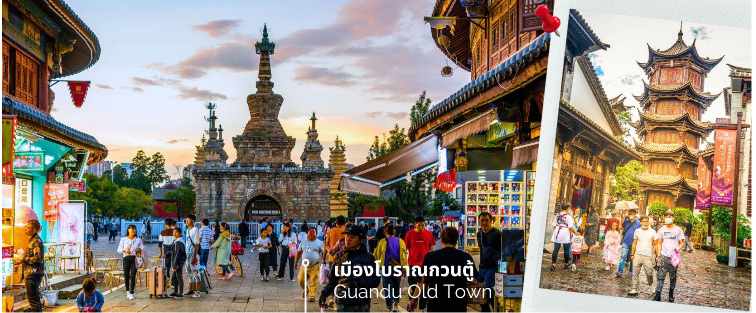
เมืองโบราณกวนตุ๋ Guandu Old Town

นำท่านชมบรรยากาศ เมืองโบราณกวนตุ๋ (Guandu Old Town) เป็นหนึ่งในต้นกำเนิดของวัฒนธรรมยูนนาน และยังเป็นหนึ่งในภูมิทัศน์ทางประวัติศาสตร์และวัฒนธรรม ที่สำคัญของเมืองคุนหมิง เมืองโบราณแห่งนี้ยังคงเป็นศูนย์กลางทางการค้าและคมนาคมที่สำคัญ ในอดีตเคยเป็นหมู่บ้านชาวประมงในสมัยราชวงศ์ถัง เมืองกวนตุ๋ยังเป็นเมืองแรกๆ ที่ศาสนาพุทธทางไนทิเบตได้เริ่มเผยแพร่เข้ามาในดินแดนยูนนาน