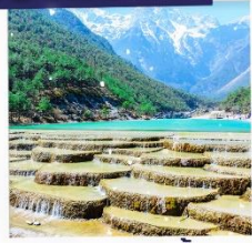
ทะเลสาบธารน้ำขาว รวมรถแบดเจอร์