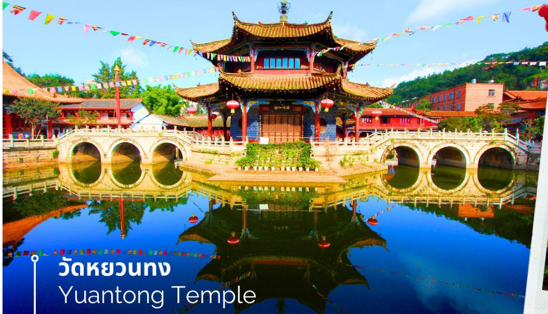
วัดหยวนทอง Yuantong Temple

นำท่านชม วัดหยวนทอง (Yuantong Temple) วัดแห่งนี้เป็นวัดที่ใหญ่และเก่าแก่ที่สุดในเมืองคุนหมิง สร้างมาตั้งแต่สมัยราชวงศ์ถัง มีอายุยาวนานประมาณ 1,200 กว่าปี การสร้างวัดแห่งนี้จะแปลกตากว่าวัดอื่นในจีน เพราะปกติแล้วการสร้างวัดของจีนส่วนมากจะต้องสร้างอยู่บนภูเขา แต่วัดหยวนทองสร้างวัดต่ำกว่าภูเขา โดยวิหารจะอยู่ต่ำที่สุด เนื่องจากวัดแห่งนี้ไม่ได้สร้างขึ้นเพื่อเป็นวัดโดยตรง แต่เคยเป็นศาลเจ้าแม่กวนอิมมาก่อน