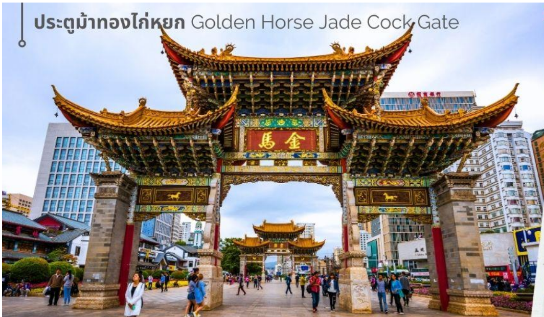
ประตูม้าทองไก่อหยก Golden Horse Jade Cock Gate

ชม ชุมประตุม้าทอง และ ชุมประตูไก่อหยก ซึ่งภาษาจีนเรียกว่าจินหม่า และปี้จี จิงเอาค้าย่อ จินปี้ มาชานาน นามถนนแห่งนี้ ชุมม้าทองและไก่อหยก มีอายุร่วม 400 ปี สร้างขึ้นในสมัยราชวงศ์หมิง ในถนนย่านการค้าแห่งนี้ เป็นแหล่งเสื้อผ้าแบรนด์เนมทั้งของจีนและต่างประเทศ รวมทั้งเครื่องประดับ อัญมณี ร้านเครื่องตี๋ม และร้านขายของที่ระลึกมากมาย