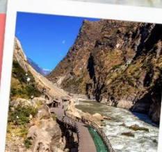
ช่องแคบเล็องกรี่โจน รวมบันไดเลื่อน ขึ้น-ลง