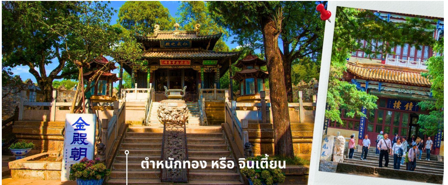
ดำหนักทอง หรือ จินเตี้ยน

นำท่านเยี่ยมชม ดำหนักทอง หรือ จินเตี้ยน (The Golden Temple Park | Jindian park) (ไม่รวมค่ารถแบตเตอร์ 10 หยวน/ท่าน) โบราณสถานสำคัญของมณฑลยูนนาน ที่ได้รับการปกป้องดูแลโดยรัฐบาลจีน ตั้งอยู่บริเวณเชิงเขาหมิงเฟิง ล้อมรอบด้วยแนวกำแพงและหอคอยเหมือนเป็นป้อมปราการ ดำหนักทองถูกเรียกตามลักษณะอาคารที่มีสีทองอร่าม จากทองเหลืองในส่วนของผนังและหลังคา รวมกว่า 200 ตัน โดยถือเป็นสิ่งปลูกสร้างสัมฤทธิ์ที่ใหญ่ที่สุดของจีน ภายในมีรูปปั้นทองโดยมีเงินอยู่ (เสวียนอู่) เทพเจ้าลัทธิเต๋าเป็นองค์ประธาน