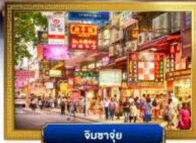
จิมซาจุ่ย