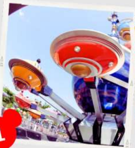
MAIN STREET USA