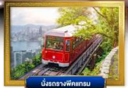
นิงรรางพิกแกรม