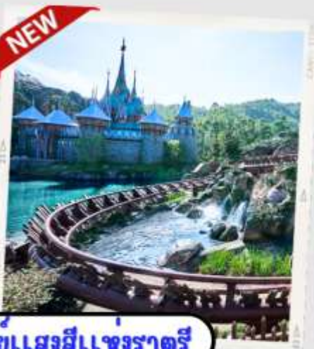
“MOMENTOUS” มหึศจรรย์ขบวนเสด็จแห่งราตรี