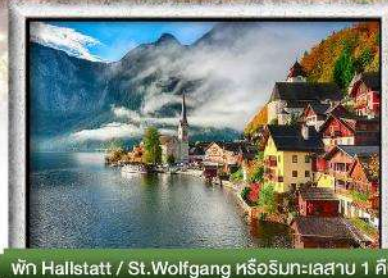
พัก Hallstatt / St. Wolfgang หรืออื่นๆ 1 คืน

พิเศษ!! ลิ้มลองเมนูประจำชาติ ทั้ง 5 ประเทศ!!!