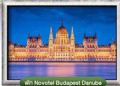
พัก Novotel Budapest Danube