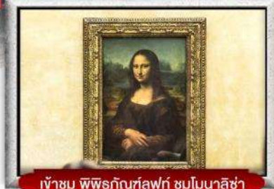
เข้าชม พิพิธภัณฑ์ลูฟวร์ ชมโมนาลิซ่า