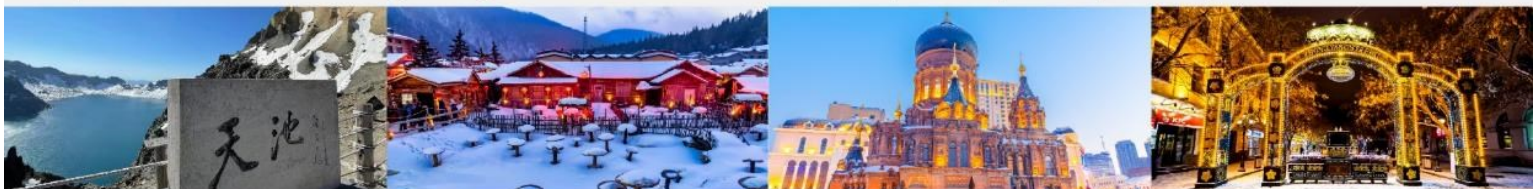
อุทยานฉางไป่ซาน