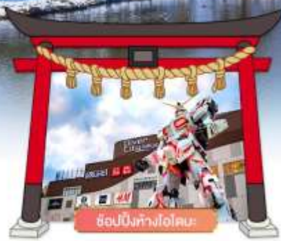
ซ็อบบิงห้างไอโดบะ