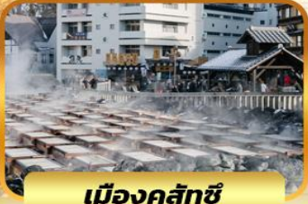
เมืองคุสัทซึ

วัดคัตสึโฮจิ วัดเบียวโดอิน วัดโกโตคุจิ หมู่บ้านพื้นเมืองฮิดะ หมู่บ้าน LITTLE KYOTO เมืองคุสัทซึ ชมยุบาทาเกะ เมืองเก่าคาวาโกเอะ ช้อปปิ้งชินจูกุ ฮิออน คารุยชาว่าเอ้าท์เล็ต