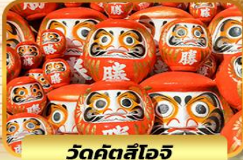
วัดคัตสึโฮจิ