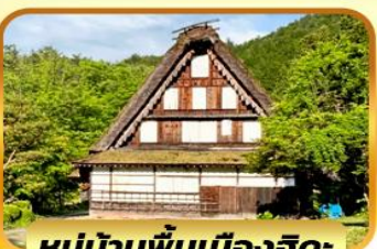
หมู่บ้านพื้นเมืองฮิดะ