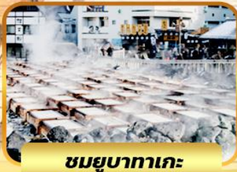
ชมยูบาทาเกะ