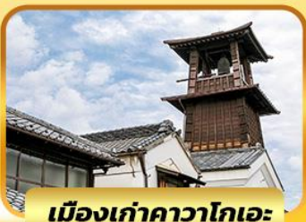
เมืองเก่าคาวาโกเอะ

พิเศษ !! บุฟเฟ่ต์ แอลกอฮอล์ไม่อื่น 2 คั้น