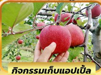
กิจกรรมเก็บแอปเปิ้ล