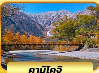
คามิโคชิ