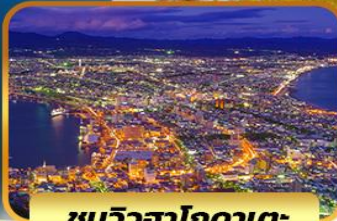
ชมวิวดาโกดาเตะ