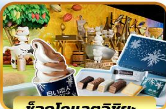
ช็อกโกแลตอิชียะ