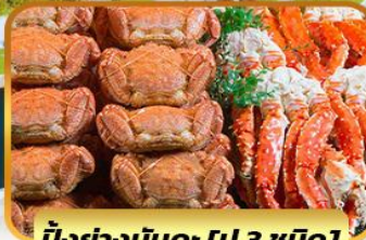
บึงย่างนินตะ [ปู 3 ชนิด]