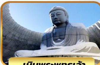
เป็นพระพุทธรเจ้า