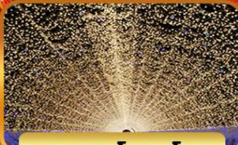
บาระนะโนะซาโตะ