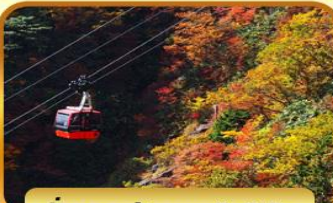
นั่งกระเช้าภูเขาโกโซโซ