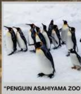
"PENGUIN ASAHIYAMA ZOO"