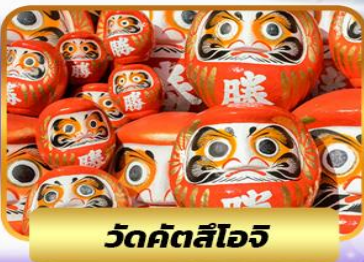
วัดคัตสึโงจิ