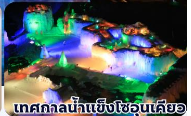
เทศกาลน้ำแข็งโซอุนเคียว