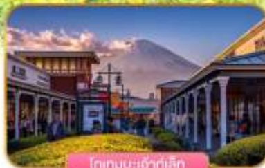
โกเทมบะเจ้าฟ้าเล็ก