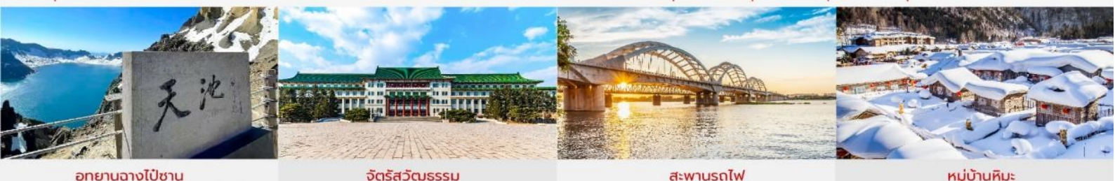
อุทยานฉางไป่ซาน