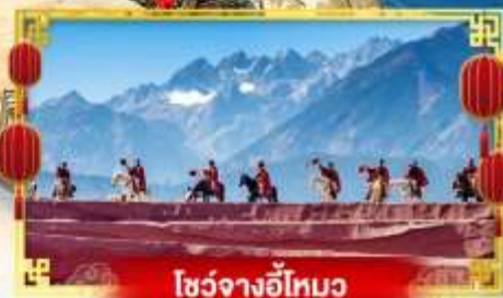
โชว์จางอวี๋ใหม่