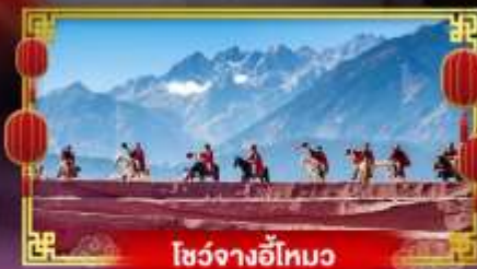
โซ่วจางอีใหม่