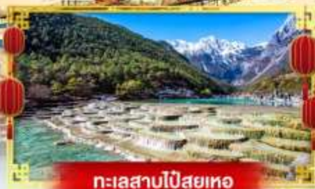
ทะเลสาบไป๋สยฺเหอ

พิเศษ! โชว์จางอวี๋ใหม่ "ความประทับใจลี่เจียง"