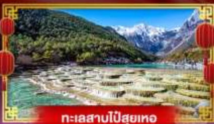
ทะเลสาบโป๋ส่วยเทอ